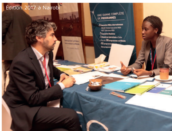
Édition 2017 à Nairobi

Des dizaines d'exposants et experts seront réunis pour répondre à vos besoins à l'international.