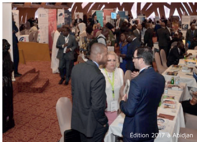
Édition 2017 à Abidjan